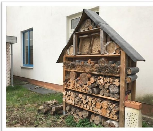
Wildbienen-Nisthilfe im Innenhof